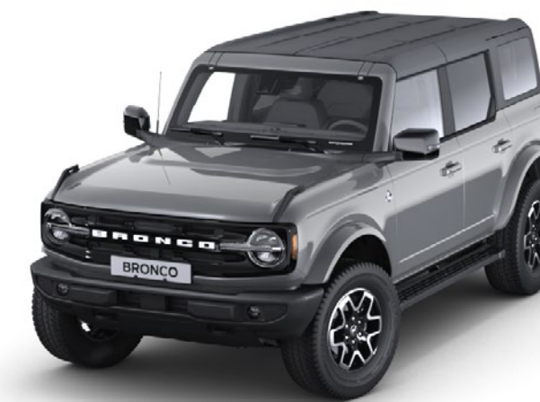
Carbonized Grey Metalfarve*