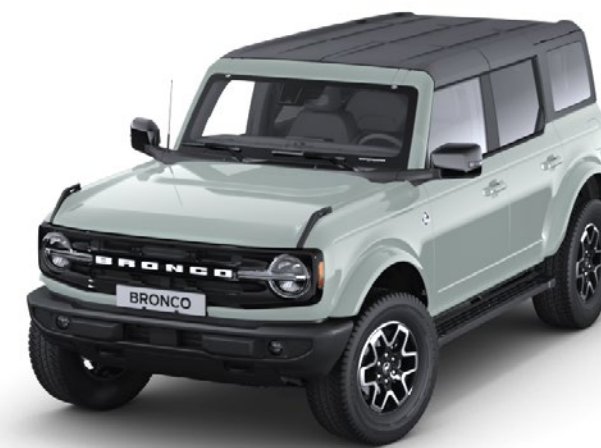
Cactus Grey Standardfarve*