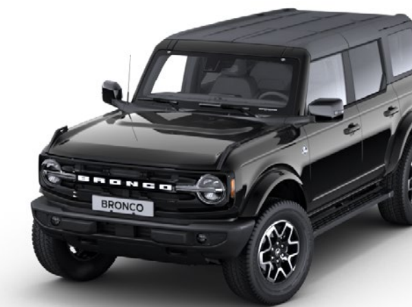
Shadow Black Metalfarve*