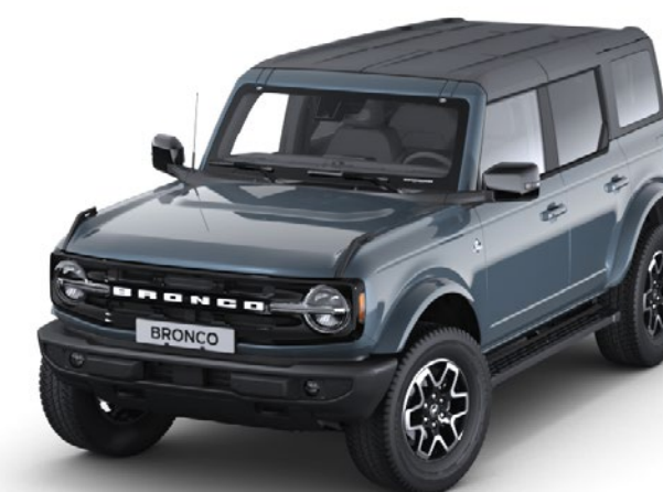
Azure Grey Metalfarve*